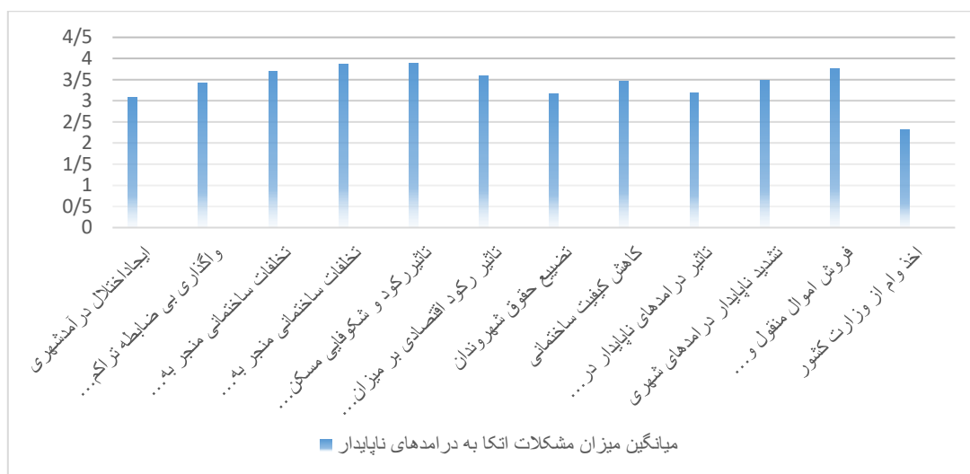
شکل ۲- میانگین نظر کارشناسان در مورد مشکلات ناشی از اتکا به درآمدهای ناپایدار

استفاده از مدل SAW جهت دستیابی به مناسب‌ترین منبع درآمدزایی با توجه به مولفه‌های پایداری و قابل اجرا بودن: