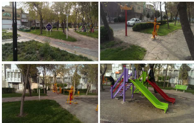
شکل ۶- بوستان مریم کوی کارمندان اول، محله کوی کارمندان، منطقه ۶ شهرداری مشهد

در منطقه ۶ که ۴ بوستان شناسایی شده است به طور کلی وضعیت فضاهای بازی و سبز متوسط و بعضاً ضعیف ارزیابی می شود، به طور کلی در شکل ۶ وسایل بازی فاقد استاندارد و تنوع می باشند. در بوستان افرا و اقا قیاسیمکت جهت نشستن موجود نیست و یا نیمکت بدون وجود پشتی و فاقد استاندارد است. و یافته های کمی با توجه به پایین بودن میانگین این شاخص در منطقه ۶ ( 2/37 ) تایید کننده ی ضعف این شاخص در منطقه ۶ شهرداری مشهد می باشد.