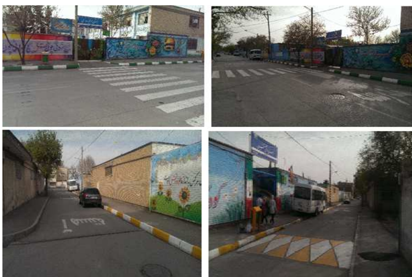
شکل ۷- ایمنی و سهولت تردد محدوده دبستان شهید مزیبانی و مرضیه مدرسی، کوی کارمندان اول، محله‌ی کوی کارمندان، منطقه ۶

در زمینه ایمنی و سهولت تردد با توجه به شکل ۷، منطقه ۶ از ایمنی و سهولت تردد مناسبی برخوردار می‌باشد. به طوریکه نه تنها از خط کشی عابر پیاده برخوردار بوده، بلکه با علایم راهنما مثل حرکت آهسته، ایست؛ به کاهش سرعت حرکت اتومبیل‌ها در نزدیکی مدارس کمک می‌کند. همچنین یافته‌های کمی مبنی بر میانگین شاخص ایمنی و سهولت تردد در منطقه ۶ که ۳/۱۴ بوده است تایید کننده‌ی وضعیت قابل قبول این شاخص می‌باشد. هرچند به طور کلی تا ایده آل فاصله وجود دارد؛ اما نتایج مشاهدات میدانی نشان دهنده‌ی وضعیت قابل قبول این شاخص در منطقه ۶ نسبت به دو منطقه‌ی دیگر (۱ و ۸) می‌باشد.