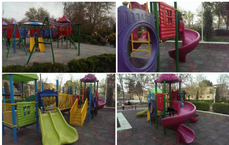
شکل ۲- وسایل بازی در پارک کوهسنگی، محله ی کوهسنگی، منطقه ۸ شهرداری مشهد

در این بخش از محدوده ی مورد مطالعه (در مناطق ۱، ۶ و ۸ شهرداری مشهد) به بررسی و تحلیل مستندات میدانی پرداخته می شود. با توجه به محدودیت در برداشت میدانی از کل مناطق، در هر منطقه یک محله به صورت هدفمند بر اساس دسترسی به مدارس، پارک و فضای سبز و محل بازی کودکان انتخاب شده است. در منطقه ی ۱ محله ی احمدآباد، منطقه ی ۸ محله ی کوهسنگی و منطقه ی ۶ محله ی کوی کارمندان مورد بررسی قرار گرفته است، تصاویر مربوط به پارک کوهسنگی منتخب در محله ی کوهسنگی منطقه ۸ نشان دهنده وسعت پارک، دسترسی مناسب به پارک محله ای، کیفیت و تنوع در وسایل بازی و همچنین قرارگیری مبلمان در محل بازی کودکان و امکان نظارت مستقیم والدین نشان دهنده ی تامین امنیت فضای بازی می باشد. همانطور که در شکل ۲ نشان داده شده است تنوع رنگی و روان شناسی استفاده از رنگ های گرم و سرد در وسایل بازی مناسب و مطابق استانداردها است. از سوی دیگر یافته های کمی وضع موجود در منطقه ۸، بیانگر پایین بودن میانگین شاخص فضاهای بازی و سبز (۲/۷۶) از دیدگاه والدین بوده است که این امر در مواردی مثل عدم اتصال به برق اضطراری در پارکها، عدم رسیدگی منظم به وسایل بازی، فرسودگی تاب ها و... بوده است و نتیجتاً بین وضع موجود و مطلوب شکاف وجود دارد.