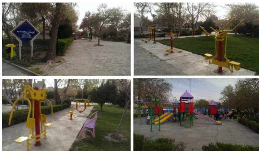
شکل ۴- بوستان محمدیه، محله ی احمدآباد، منطقه ۱ شهرداری مشهد

شکل ۴ بوستان محمدیه در محله ی سعدآباد را نشان می دهد که پارک ها از وسعت مناسب، وسایل ورزشی، وسایل بازی با کیفیت و استاندارد، نیمکت های مناسب و پوشش گیاهی مناسب برخوردار است. اما تنوع وسایل بازی زیاد نیست. غالباً وسایل بازی در پارک ها از جنس پلی اتیلن و استاندارد بوده و کفپوش ها مسطح و نرم است. همچنین پوشش گیاهی، درختکاری و گلکاری نیز مناسب است این در حالی است که یافته های کمی در زمینه ی فضاهای بازی و سبز در منطقه ۱ بیانگر پایین بودن میانگین این شاخص می باشد، به طوریکه از حد متوسط نیز کمتر است ( ۲/۸۷ ) و بین وضع موجود و مطلوب شکاف بارزی از منظر این شاخص نه تنها در منطقه ۱، بلکه در دو منطقه ی دیگر نیز وجود دارد.