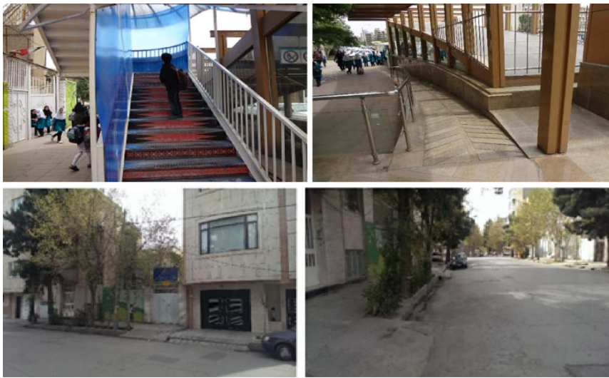
شکل ۵- ایمنی و سهولت تردد محدوده دبستان ربابه اکبرزاده و حانیه، محله احمدآباد، منطقه ۱ شهرداری مشهد،

شکل ۵ ایمنی و سهولت تردد در محله ی احمدآباد منطقه ۱ را نشان می دهد، با توجه به تصاویر این منطقه ایمنی و سهولت تردد به طور یکسان رعایت نشده است. همانطور که مشاهده میشود درب یک مدرسه به سمت پل هوایی و زیرگذر باز میشود، و در سی متری اول احمدآباد نیز تمام مسیر خط کشی شده است و مدرسه ای دیگر فاقد هرگونه علائم راهنما، خط کشی با وجود پهنای خیابان میباشد. میانگین شاخص ایمنی و سهولت تردد در منطقه ۱ در بخش کمی نیز 3/54 بوده است که بالاتر از حد متوسط است اما با ایده آل و استانداردها فاصله ی زیادی وجود دارد. و این شاخص در سطح کل منطقه ۱ متوازن نبوده است.