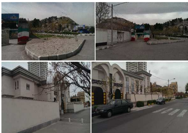
شکل ۳- ایمنی و سهولت تردد محدوده ی دبستان الغدیر و دارالقرآن امام رضا، محله کوهسنگی، منطقه ۸ شهرداری مشهد

کمی نیز نشان دهنده ی این است که ایمنی و سهولت تردد در منطقه ۸ با میانگین ۳/۰۷ در مرز متوسط قرار دارد و با وضعیت ایده آل فاصله وجود دارد.