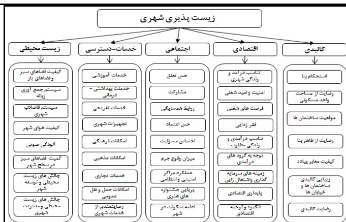
شکل ۱- مدل مفهومی پژوهش.

بستر حضور و گسترش ایده زیست‌پذیری را می‌توان آمریکا دانست. واژه شهرهای زیست‌پذیر برای اولین بار در سال ۱۹۷۰ توسط اداره ملی هنرها به‌منظور دستیابی به ایده‌های برنامه‌ریزی شهری مدنظر آنان و به دنبال آن توسط سایر مراکز و سازمان‌های تحقیقاتی نظیر اداره حفاظت محیطی به کار گرفته شد (ساسان‌پور و همکاران، ۱۳۹۲: ۱۳۴).