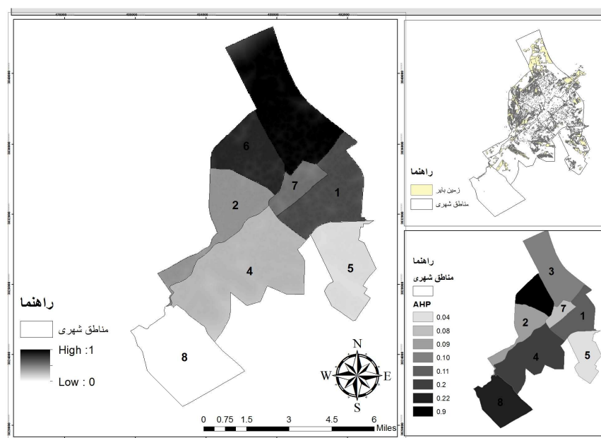
شکل ۴- تحلیل فضایی مناطق شهری قم به منظور احداث پروژه مسکن اجتماعی با تاکید بر روش AHP

شکل (۴) خروجی مدل AHP را در محیط GIS نشان می دهد، نشان دهنده اولویت مناطق هشت گانه شهر قم برای احداث پروژه مسکن اجتماعی است. همان طور که در نقشه مشاهده می شود با توجه به معیارهای شش گانه و زیرمعیارهای آنها منطقه ۸ شهر قم، مناسب ترین منطقه شهر برای احداث پروژه مسکن اجتماعی است و مناطق ۲ و ۳ نیز مناسب ترین منطقه بعد از منطقه ۸ هستند. نامناسب ترین منطقه، منطقه ۵ است که کمترین امتیاز و وزن را داشته است.